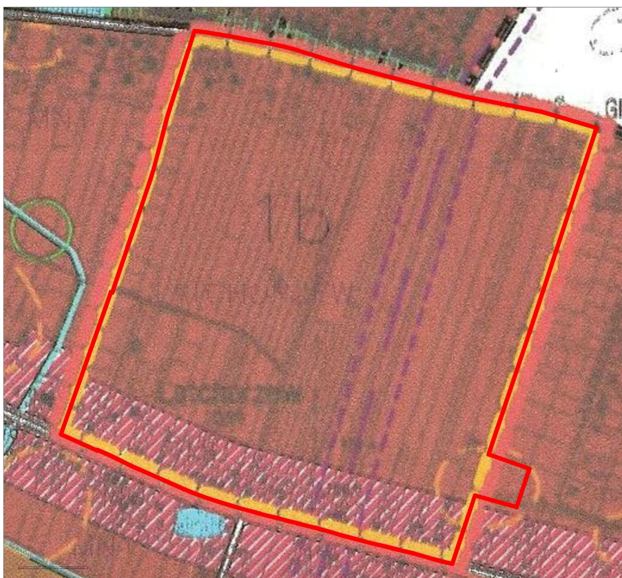
Rys. 4. Wycinek z rysunku Studium Uwarunkowań i Kierunków Zagospodarowania Przestrzennego gminy Stare Babice dla planu obejmującego fragment wsi Latchorzew.

Zgodnie ze Studium (Rys.4), wiodącym kierunkiem zagospodarowania w granicach opracowania są obszary skupionego osadnictwa mieszkaniowego jednorodzinnego MN1.