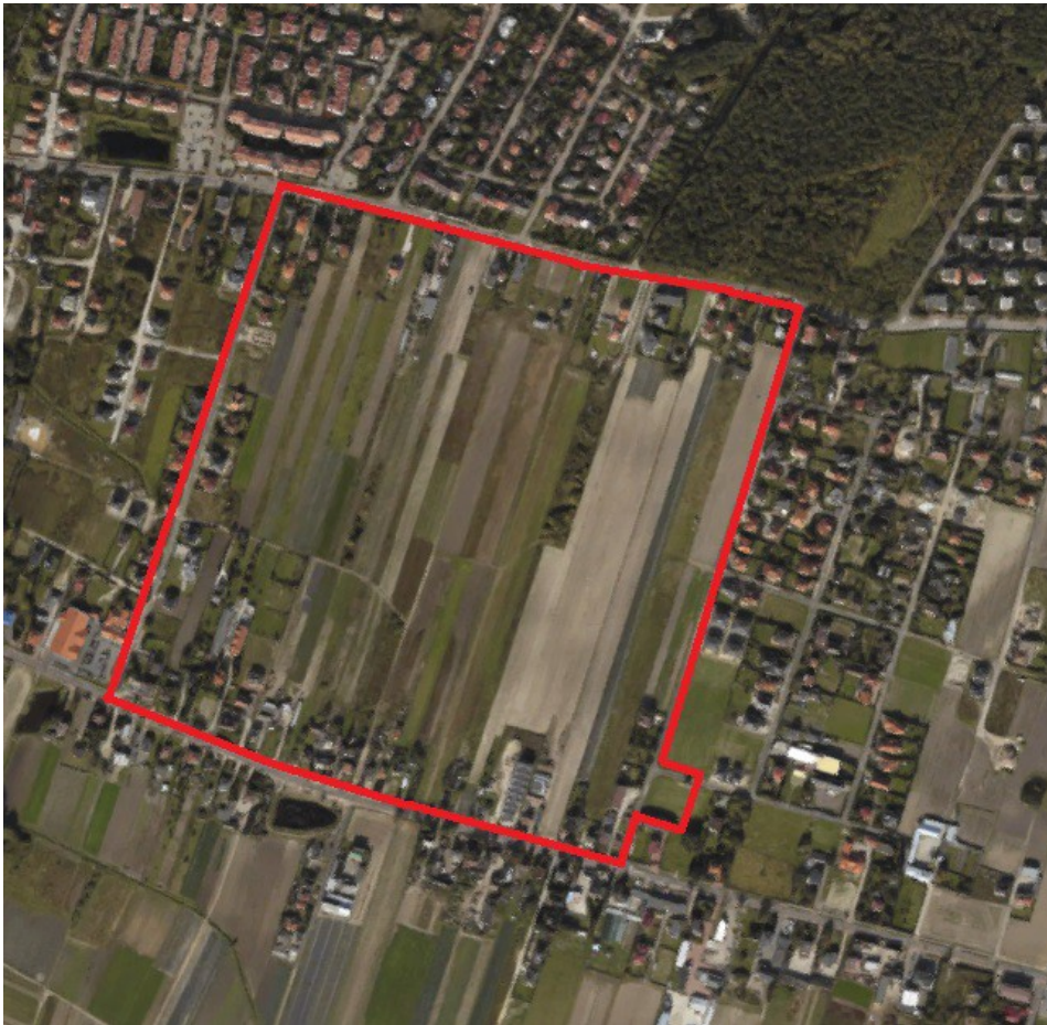
Rys. 2 Zdjęcie lotnicze z naniesioną granicą opracowania.