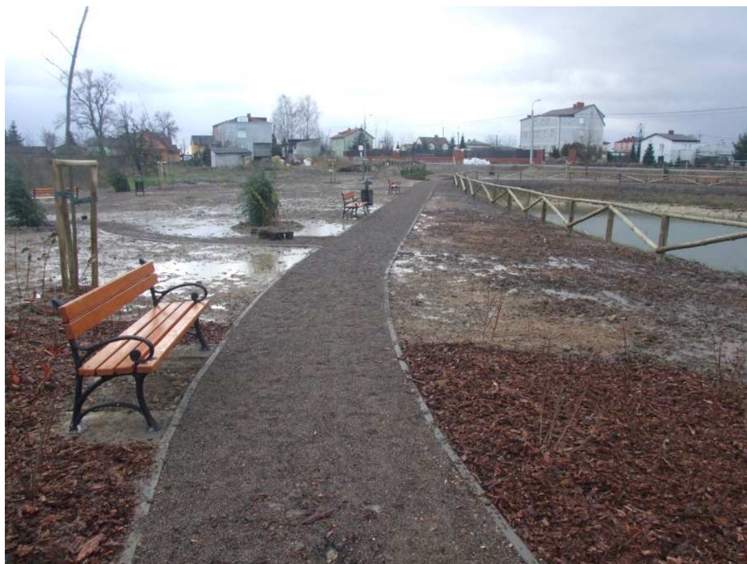
Widok stawu przy ul. Spacerowej w Borzęcinie Dużym w trakcie realizacji projektu zagospodarowania