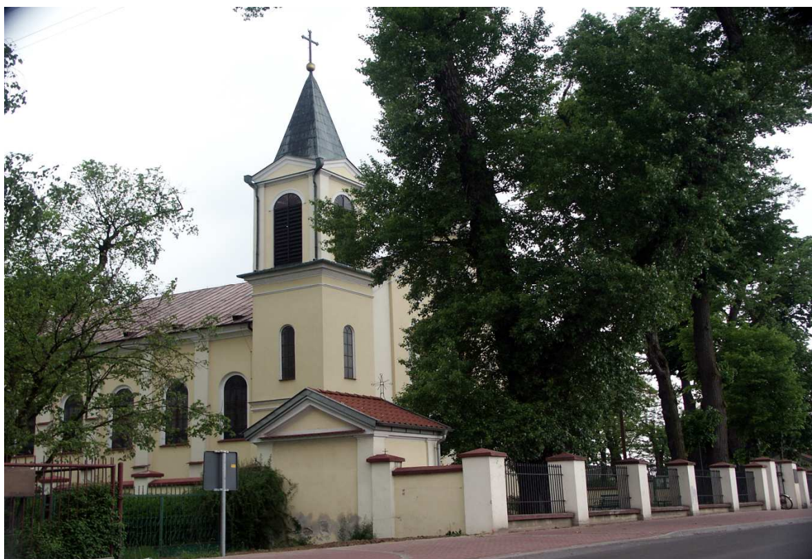
Kościół pw. Św. Wincentego Ferreriusza

Obecnie został wyremontowany i zmodernizowany. Do ważniejszych robót należy zaliczyć: elektryfikację kościoła, budynków mieszkalnych i gospodarczych parafii. Przeprowadzono gruntowną rekonstrukcję plebanii. Odnowiono prezbiterium i wielki ołtarz, wmontowano dwa witraże. Kościół zradiofonizowano oraz założono centralne ogrzewanie. (nr Ewidencji Rejestru Wojewódzkiego Konserwatora Zabytków 1201).