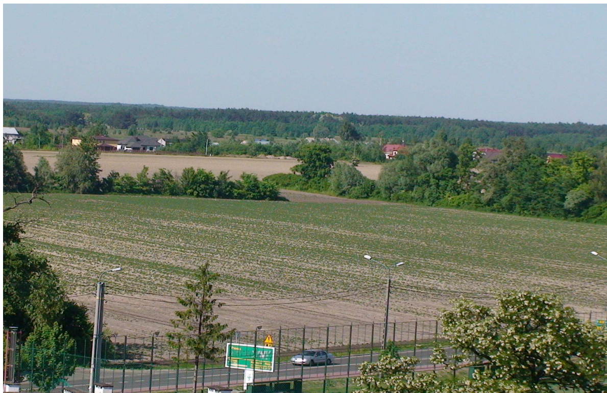
Widok na drogę Warszawa-Żelazowa Wola-Sochaczew w Borzęcinie Dużym