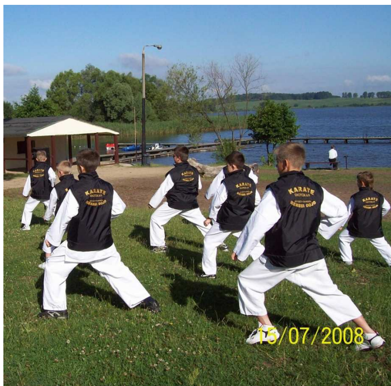
Zajęcia sekcji karate Borzęcińskiego Stowarzyszenia Kulturalno – Sportowego