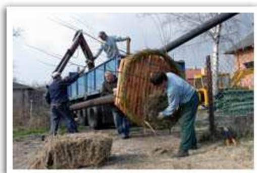
Instalowanie platformy gniazda dla bocianów w Borzęcinie Dużym