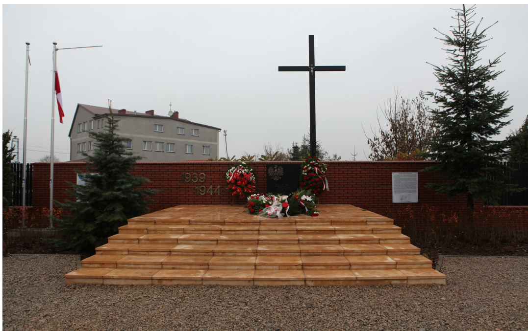
Miejsce Pamięci Narodowej - Obelisk z tablicą upamiętniającą ofiary II Wojny Światowej w Borzęcinie Dużym.

II Wojna Światowa obeszła się okrutnie także z cywilnymi mieszkańcami Borzęcina Dużego. 8 sierpnia 1944 r. Hitlerowcy zamordowali tu 49 osób, spośród których większość stanowili mieszkańcy tej miejscowości. Reszta to uciekinierzy z Warszawy objętej powstaniem. Okupanci mordując bezbronne ofiary mścili się za atak partyzancki na skład amunicji w Borzęcinie Dużym, który miał miejsce 7 sierpnia 1944 r. Wówczas w wyniku ostrzału zginęło 39 osób, wśród których byli partyzanci, strażacy i mieszkańcy Borzęcina.