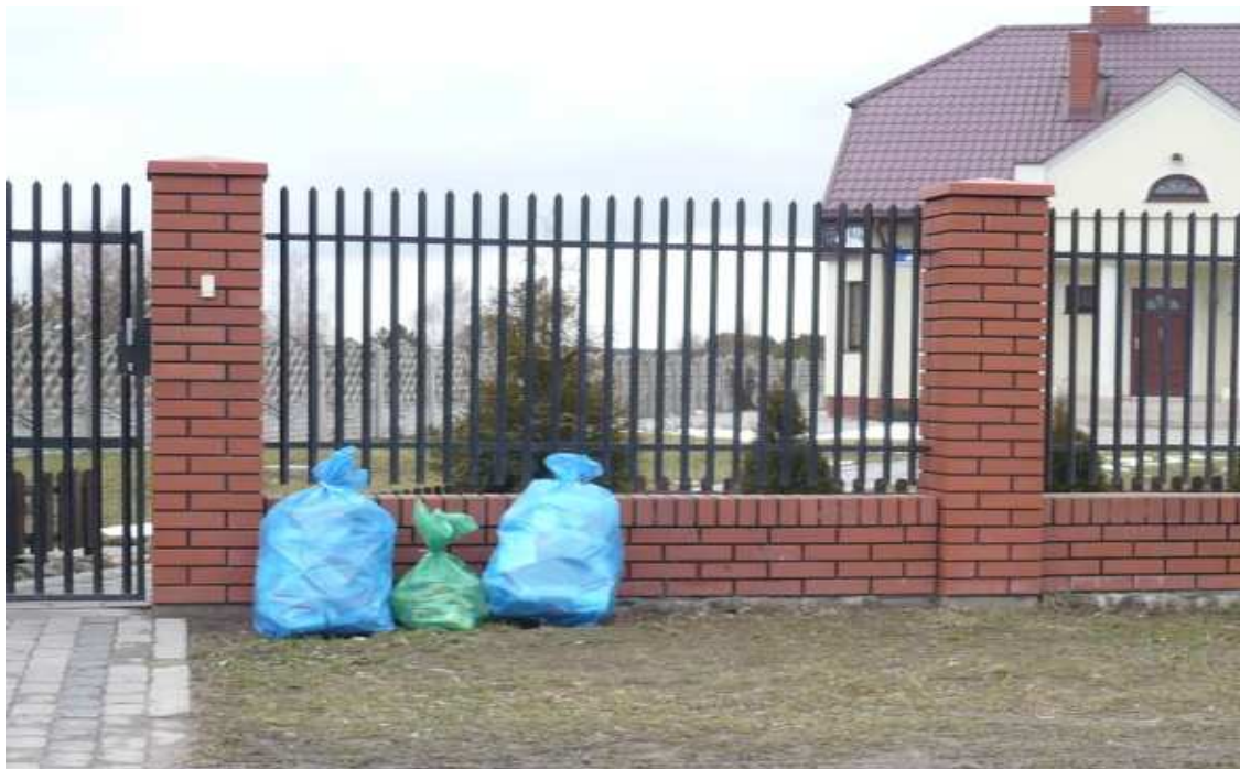
Sposób odbioru segregowanych odpadów w Gminie Stare Babice

Od roku 2008 prowadzona jest na terenie gminy akcja usuwania wyrobów zawierających azbest (eternitu) stanowiąca realizację „Gminnego programu usuwania wyrobów zawierających azbest”. Udział w akcji mieszkańców wsi Borzęcin Duży to ponad 2690 m 2 eternitu usuniętego w latach 2008 - 2009.