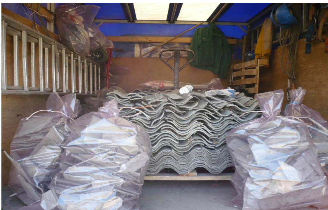
Sposób odbioru eternitu z gospodarstw domowych z terenu Gminy Stare Babice w ramach „Gminnego programu usuwania wyrobów zawierających azbest”

Od roku 2008 prowadzona jest na terenie gminy akcja usuwania wyrobów zawierających azbest (eternitu) stanowiąca realizację „Gminnego programu usuwania wyrobów zawierających azbest”. Udział w akcji mieszkańców wsi Borzęcin Duży to ponad 2690 m 2 eternitu usuniętego w latach 2008 - 2009.