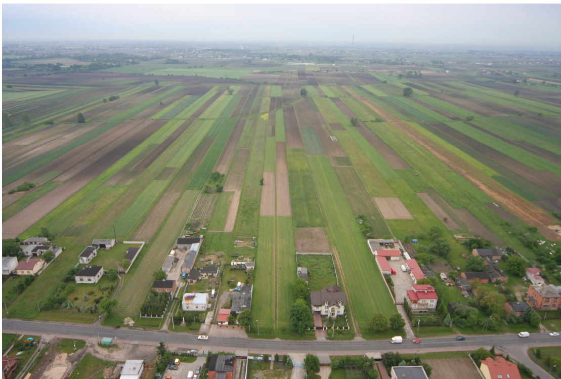
Okolice Borzęcina Dużego