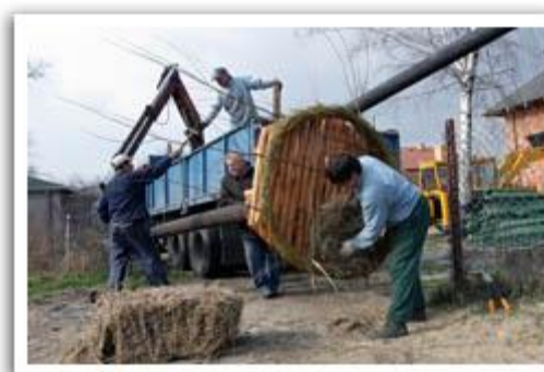
Instalowanie platformy gniazda dla bocianów w Borzęcinie Dużym