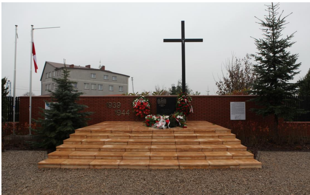
Miejsce Pamięci Narodowej - Obelisk z tablicą upamiętniającą ofiary II Wojny Światowej w Borzęcinie Dużym.

II Wojna Światowa obeszła się okrutnie także z cywilnymi mieszkańcami Borzęcina Dużego. 8 sierpnia 1944 r. Hitlerowcy zamordowali tu 49 osób, spośród których większość stanowili mieszkańcy tej miejscowości. Reszta to uciekinierzy z Warszawy objętej powstaniem. Okupanci mordując bezbronne ofiary mścili się za atak partyzancki na skład amunicji w Borzęcinie Dużym, który miał miejsce 7 sierpnia 1944 r. Wówczas w wyniku ostrzału zginęło 39 osób, wśród których byli partyzanci, strażacy i mieszkańcy Borzęcina.